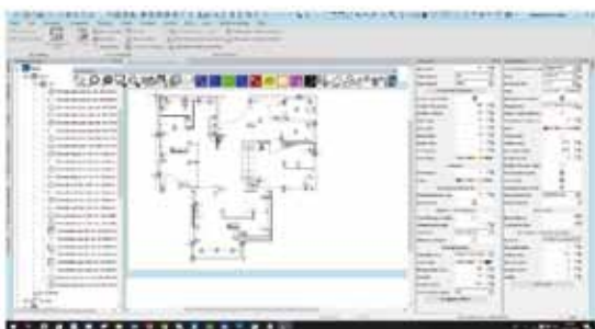
Die Vorteile nutzen: mit dem intelligenten CAD-System comcad