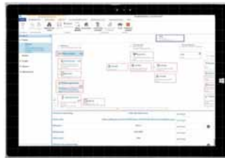
comSCHÄCKE: Zeichnen, Messen, Dokumentieren