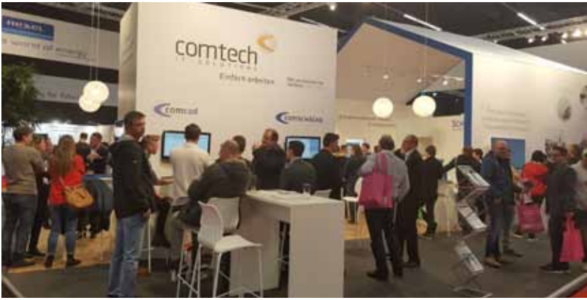
Starker Andrang bei Comtech auf den Power-Days