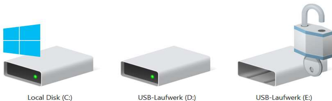
Beispiel: Symbol USB-Stick (rechts), bereits mit BitLocker verschlüsselt

https://www.wko.at/service/wirtschaftsrecht-gewerberecht/EU-Datenschutz-Grundverordnung:-Checkliste.html